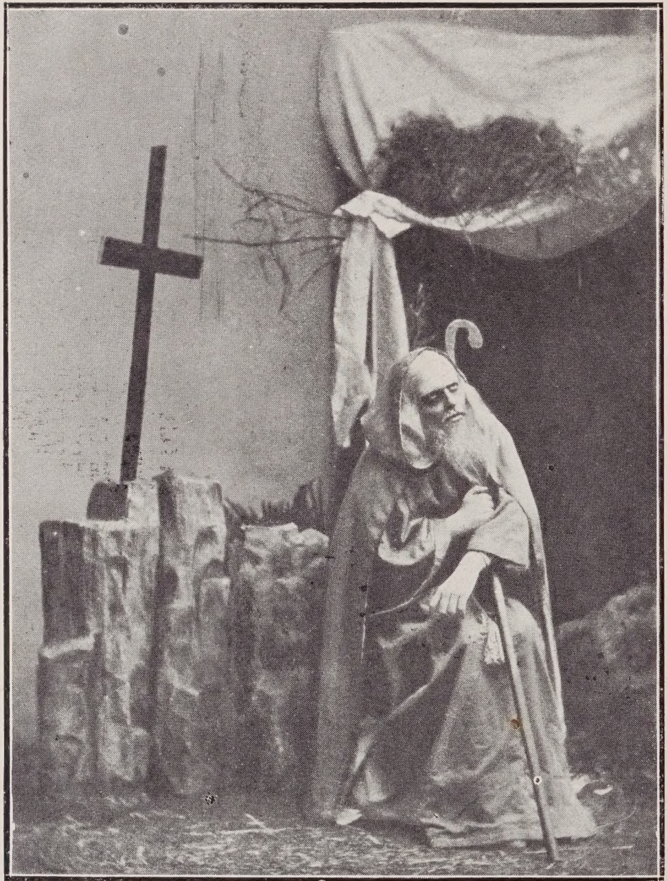
Giuseppe Borgatti nell' « Antonj » del Galeotti